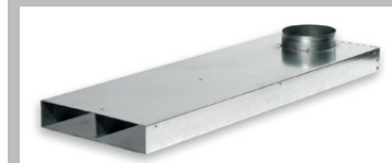
(b) Elemento diritto - chiusura, 100 cm