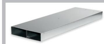
(a) Elemento diritto 100 cm risp. 50 cm