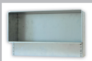
(h) ZKS scatola di montaggio con apertura disotto (ZKSMONTU) o apertura posteriore (ZKSMONTH)