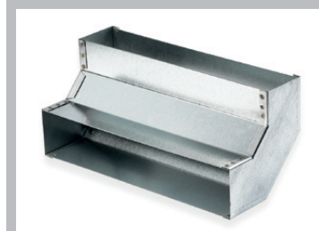
(e) Elemento ricurvo verticale 90°