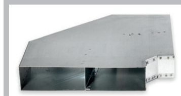
(d) Elemento ricurvo orizzontale 90°