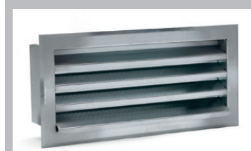
(f) Griglia per scatola di montaggio